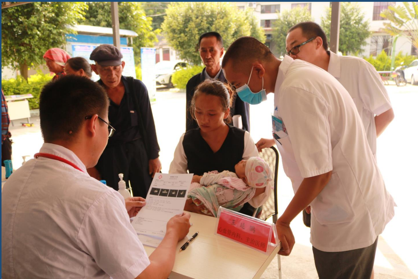
有序排队等候检查的群众