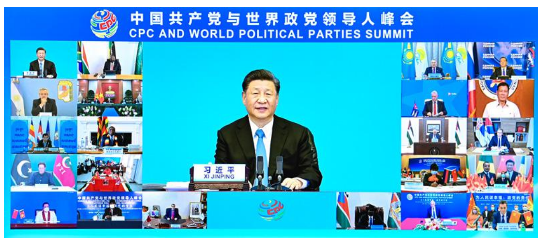
7月6日，中共中央总书记、国家主席习近平在北京出席中国共产党与世界政党领导人峰会并发表主旨讲话。

习近平强调，今天，人类社会再次面临何去何从的历史当口，选择就在我们手中，责任就在我们肩上。面对共同挑战，人类只有和衷共济、和合共生这一条出路。政党作为推动人类进步的重要力量，要锚定正确方向，担起历史责任。